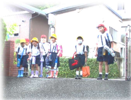
【坂小の伝統 校門一礼の様子】