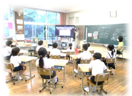
【リモートで行った始業式】