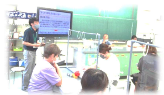
坂瀬川小学校 地域学校協働活動「すくすく芽生えの会」

新しい「すくすく芽生えの会」は、地域学校協働活動推進員を中心とした3つのチームから構成しました。これから「学習」「健康・安全」「体験活動・環境整備」の分野について、地域の方々から支援ボランティアの方々を募っていき、様々なご意見をいただきながら、本校区の実情に応じた活動を徐々に形づくっていきたいと考えています。新「すくすく芽生えの会」の活動にご理解並びにご協力をお願いいたします。