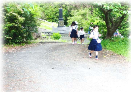
【地震津波避難訓練】

子どもたちの身の回りには、自然災害を含め様々な危険が潜んでおり、思わぬ場面でそれらに出会う可能性があります。そのような時に必要になるのは、あらかじめ身に迫る危険を予測し、自分を守るために、どのように行動すべきかを自ら判断する力だと考えています。「先生が近くにいない時に大きな地震が起こったらどうしますか。」「昼休みに地震が来たらどうしますか?」といったことを子どもたちに投げかけ、子どもたち自身に考えさせる学習を行っています。また、「こんな場面では、どんな危険が潜んでいると思いますか。」と問いかけながら色々な視点を出させ、「予想される危険から自分の身を守るためには、どうしたらよいでしょう。」と考えさせ、危険回避能力を高めているところです。子どもたちに考えさせながら進めるため、教師が回避方法を指示する取組よりも多少時間はかかるかもしれませんが、粘り強く継続していきたいと思えます。