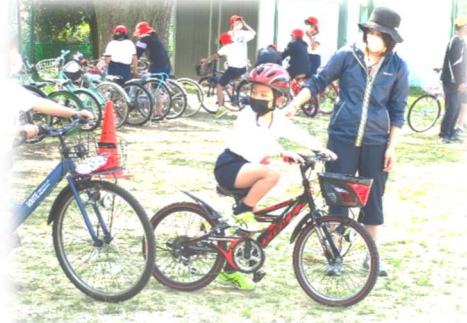
【自転車の点検と乗車訓練】