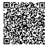
火山登山者向けの 情報提供ページ