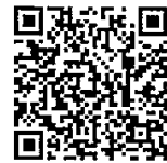
噴火速報について