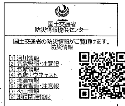
防災情報提供センター 携帯端末向けホームページ (Top)