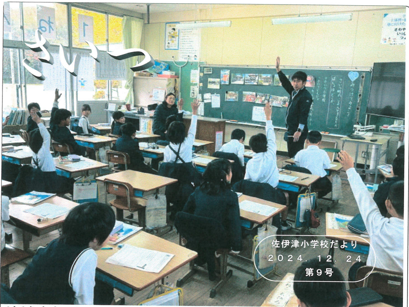
佐伊津小学校だより 2024. 12. 24 第9号