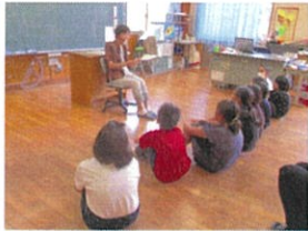
お話に聞き入る3～5年生