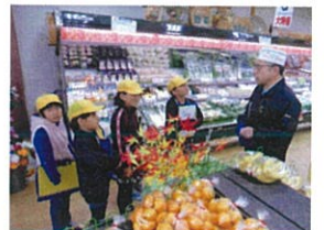
お店の仕事を聞きました