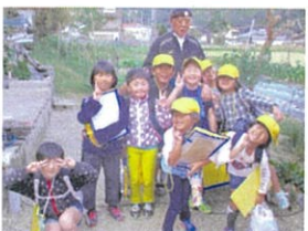
楽しい探検でした

←この日、1・2年生は 生活科探検 で初神・上四浦方面に行きました。秋の自然を観察したり、溝口製茶様や慈法院様などにお邪魔したりして、地域のことをいっぱい知りました。