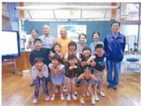
聞いてくれてありがとう

10日(水)に、1年生は国語で学習した「くじらぐも」の 音読発表会 を開きました。2年生や「きたっこ元気会」の皆さんがお客様にはりきって音読をしました。1年生はうれしくてたまりません。みんなニコニコ笑顔になりました。