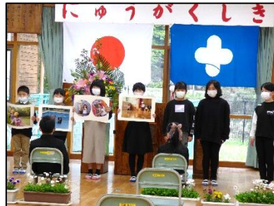
在校生歓迎の言葉