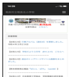
スマートフォンの画面