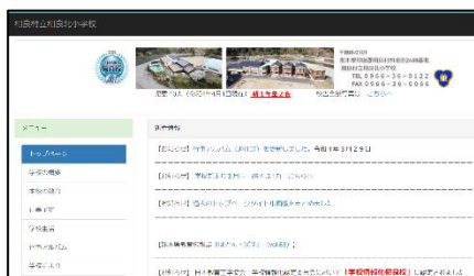
コンピュータの画面

学校の教育活動や学校だよりなど、ホームページでも公開していますので、ぜひご覧ください。