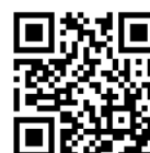
ホームページのQRコード