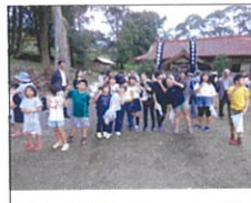
ご褒美にニッコリ!