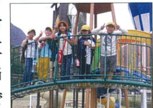
五木源パークにて