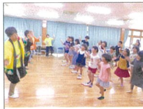
おひさまの会の皆様