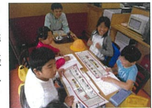
工場で説明を聞きました