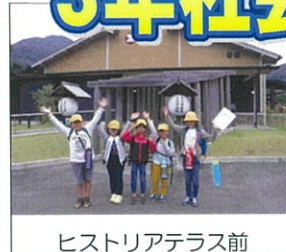
ヒストリアテラス前