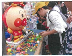
カラーボール釣り