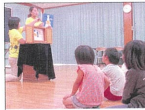
読み聞かせ(紙芝居)

きたっこは読書が大好きです。10月1日(火)~11日(金)に読書旬間を実施しました。