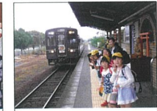
くま川鉄道に乗ります