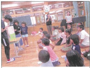
図書委員会による「ニャーゴ」