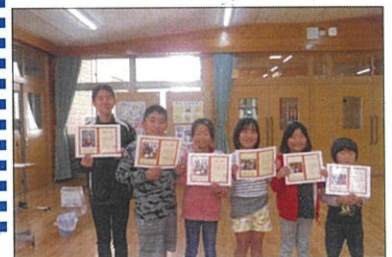
10月自学月間 MVP 受賞者