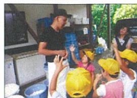
親父のガンコとうふ様