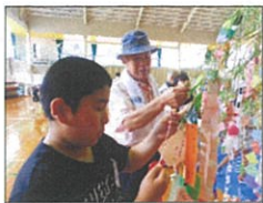
お願いします!(季柳さん)