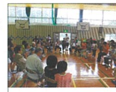
輪になって肩もみ開始