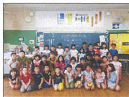
2年生全員の集合写真