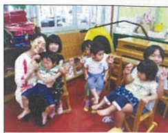
四浦保育所あざみ園様