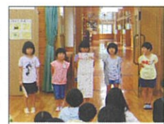
1・2年生の人権宣言

7月8日(月)に人権集会をしました。人権学習で勉強したことと各学級で決めた人権宣言を発表しました。ときどき見え隠れするいじわるな心としっかり向き合い、正義と勇気の気持ちをもち生活していきます。