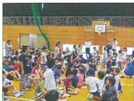
北小の校歌を歌いました