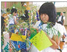
叶いますように(芽衣さん)