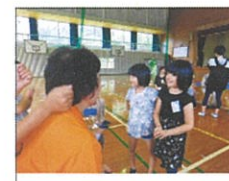
お話ししましょう!