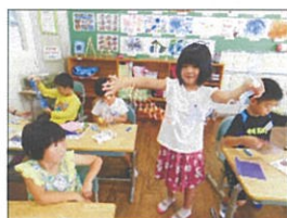
1年生七夕飾りづくり

1・2年生は、6月26日(水)に生活科の学習で田代地区探検に出かけました。最初は懐かしいあざみ保育園様。久しぶりに先生方と会ってうれしい!!。次は四浦郵便局様。局長様からお仕事について教えてもらいました。ちょっと歩いて権頭医院様へ。先生からお医者さんの仕事についてお話してもらいました。道を渡って、ガンコとうふ様の工場を見学しました。大豆が豆腐になるまでを教えてもらい、できたての豆腐と油揚げを試食させてもらいました(ガンコとうふ様のFacebookもチェックしてください)。最後は佐藤商店様。たくさんの商品が並べてありました。みなさんにとってもやさしくしていただき大喜びでした。お忙しい中にお邪魔しました。ありがとうございました。