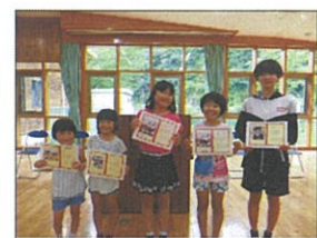
7月自学月間MVP受賞者