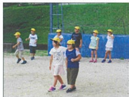
3年みんなでドッジボール