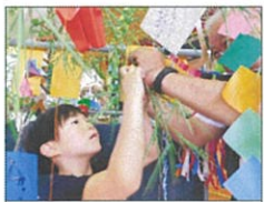
叶いますように(紫音さん)