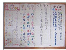
各学級の人権宣言