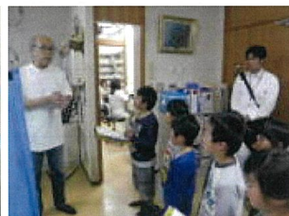
権頭先生に質問しました