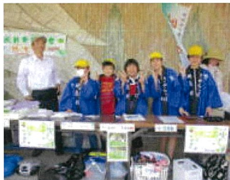
5年生は接客と販売にフル稼働でした