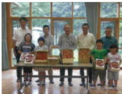
相良村施設園芸部会の皆様