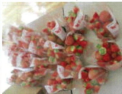
袋いっぱいのトマトといちご

会の皆様から、相良村産の真っ赤なトマト、ミニトマト、いちごをたくさんいただきました。地元産の野菜はおいしくて安心です。ご覧のように袋いっぱいになりました。みんな大喜びで家に持ち帰りました。翌日の感想は「おいしかったあ〜」。