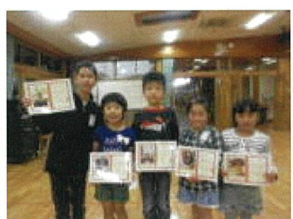
春休みと4月自学月間MVP

北小は勉強もがんばります。小さい学校だから、学力充実の時間は徹底した個別指導です。1年生4人に先生4人が付いて勉強しました。家庭学習(自主学習)をがんばったら表彰もしています。