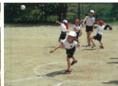
ソフトボール投げをする1年生