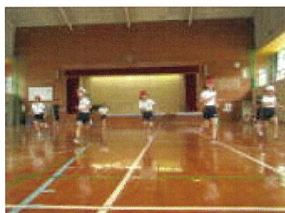
シャトルランをする3・4年生

5月28日(月)、新体力テストを実施しました。今年度から1ヶ月遅い実施です。児童の体力は向上していますが、走力と瞬発力が課題です。記録更新のために、汗をいっぱいかいてがんばりました。