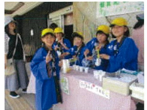
お茶入れに忙しい3・4年生