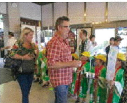
外国人観光客にもお茶をどうぞ!!