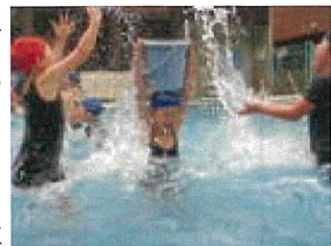
バケツ水入れ競争

6月4日(月)は☀。子どもたちが待ちに待っていたプール開きをしました。1・2年生は小プール、3年生以上は大プールで、水中じゃんけんをしたり、うずまきを作ったりして初泳ぎを楽しみました。「きゃー、冷た〜い」という歓声。でも、顔はにこにこ。いっぱい泳いで泳力向上します。