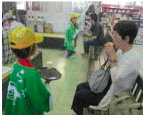
待合室でお茶をふるまう2年生