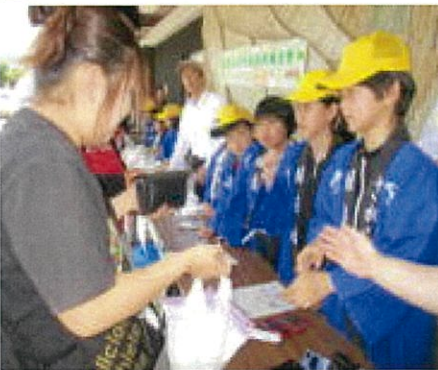
お客様との受け答えも上手でした

これまで様々な面でご支援とご協力いただきました「きたっこ元気会」と保護者の皆様、また、このような学習の場をご提供いただきましたJR人吉駅様、人吉駅弁やまぐち様、くまがわ鉄道様、人吉市観光協会様に感謝申し上げます。