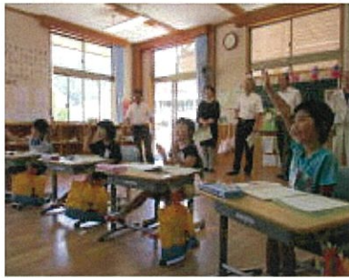
1・2年生の授業参観