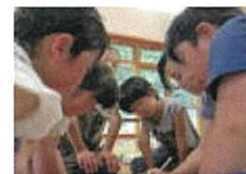
真剣に話し合いました

ベルアップ大作戦」についてみんなで話し合いました。ニコニコあいさつをして「心やさしく」なるようにがんばります。