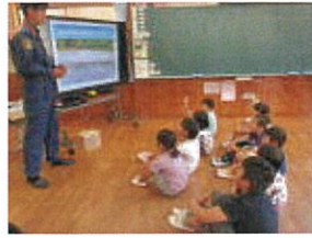
真剣にお話を聞く1・2年生