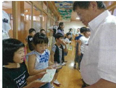
きたっこ茶のプレゼント