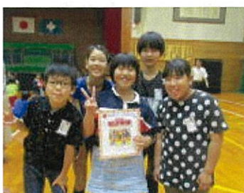
5年は色紙をもらいました

6月14日(木)、南小と交流学习を行いました。1年生は初めてのことで緊張した様子でしたが、南小のみなさんがやさしく迎えてすぐになかよしになりました。2年生以上は少し余裕がありました。ミュージカル「ピノキオ」の鑑賞はとても楽しかったようで、喜んで見ていました。各学年での学習では、大人数の中に入っていつも違った雰囲気勉強していました。給食も、昼休みの遊びも楽しかったようです。欲目でしょうが、北小の子どもはとてもおこさんでした。