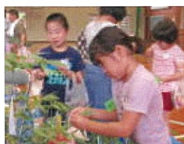
願い事が叶いますように

8月5日(日)に日経ホール(東京)で開催される「第3回小さな音楽会コンクール」に、北小の2~4年生10人が出演することが決まりました。元気いっぱい歌ってきます。