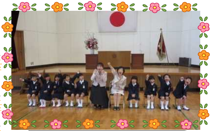
1年生、9名。緊張の入学式。 ぴかぴかの1年生で張り切っています。