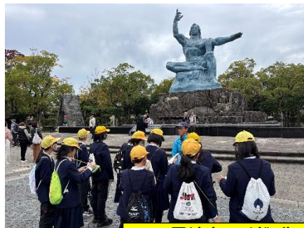
長崎さるくガイドさんとのフィールドワーク