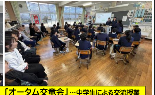
「オータム交電会」…中学生による交流授業