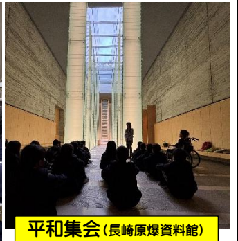
平和集会（長崎原爆資料館）