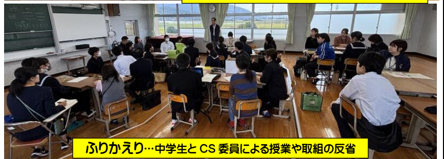
ふりかえり…中学生とCS委員による授業や取組の反省