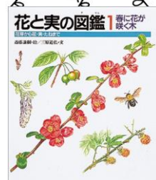
「春に花が咲く木 花