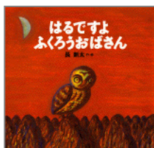
「はるですよ ふくろうおばさん」