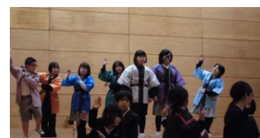
4年「龍瓶の家族に乾杯」