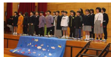
5年「環境について ～水俣から学んだこと～」