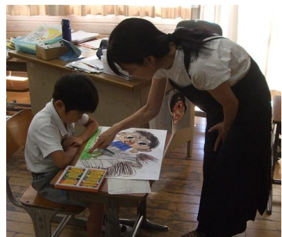
「この色にするといいね。」