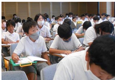
【語り部さんの講話】