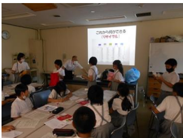
【環境についての学習】