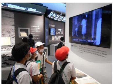
【展示されているパネルや資料を見学】