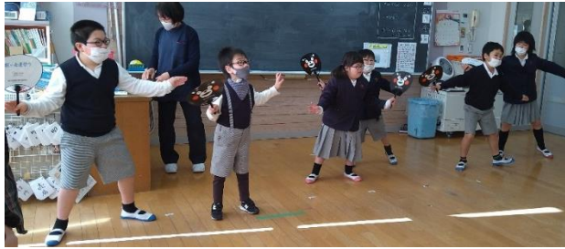
ひまわり1組・2組「わたしたちは健康です」