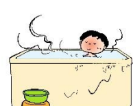
ストレッチ・お風呂でゆっくりする

さまざまなことを制限され、自由にできないことへの不満や、いつ自分や家族がコロナウイルスに感染するかわからない不安で心の中にいっぱいになっていませんか。また悲しいことに、医療の最前線で戦っている医療従事者の方々が、その家族への差別もおこっています。からだだけでなく、心も元気でいられるよう、リフレッシュしていきましょう。