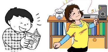
好きなことをする