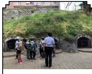
山里小学校の防空壕