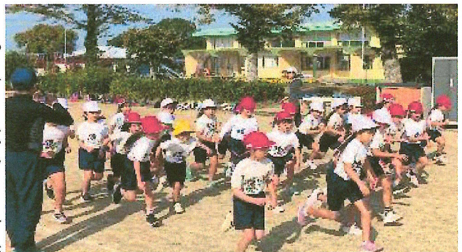
持久走大会練習で、元気にスタートを切る子どもたち

12月18日は、ご都合がつかれるならば、是非とも子どもたちの頑張る姿に応援をお願いしたいと思います。また、子どもさんの体調管理もよろしくお願いいたします。