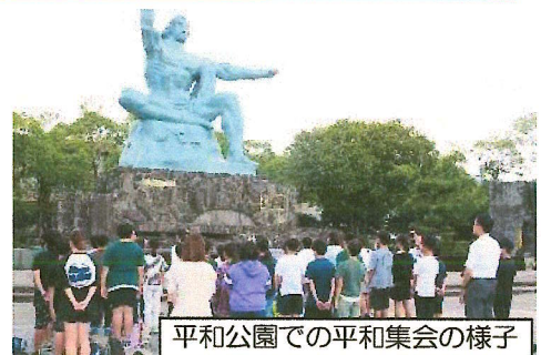
平和公園での平和集会の様子

9月25日(水)から1泊2日で、6年生は長崎修学旅行に行ってきました。長洲港からフェリーに乗って、長崎市内に到着。到着後、被爆2世の方から講話を聴いたり、浦上天主堂、如己堂、山里小学校、原爆資料館などの見学をしたりして平和学習に取り組みました。また、平和公園前では平和集会を行いました。メモを取りながら講話を真剣に聴く姿、資料館の展示物を真剣に見つめる姿、自分の思いや感想を発表する姿に、6年生の真剣さがしっかりと伝わってきました。その後は、グラバー園での見学をしてホテルに到着しました。2日目は、出島を見学した後に、ハウステンボスで班別活動をして楽しみました。汗びっしょりになりながらも、友達と協力しながらアトラクションを回る子どもたち。更に友情を深めることができました。また、学校とは違う最高の笑顔を見ることができました。6年生の保護者の皆様には、子どもたちの送迎とお迎え、また、旅行の準備など本当にありがとうございました。今後もよろしくお願いします。