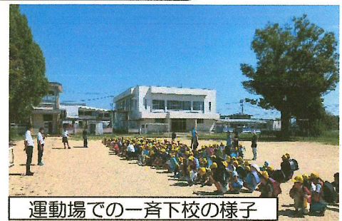
運動場での一斉下校の様子

また、朝の登校について、レインボー宮野の前の道を通って来る児童が多いですが、児童は車道の右側と左側に分かれて登校して危険です。先日、警察からも指導がありました。今後は、 車道の右側を通るように指導 します。各家庭でも車道の右側を通るようにご指導お願いします。