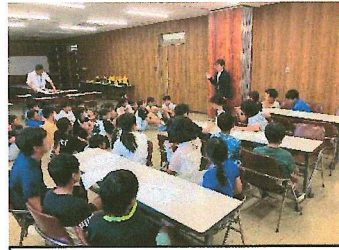
6年生長洲町議会見学