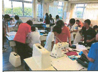
6年生家庭科ミシン学習