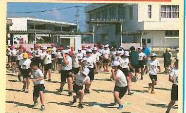
全員での準備運動の様子

9月になりましたが、まだまだ残暑が厳しい毎日です。そんな中、先週から長洲町陸上記録会に向けての練習が始まりました。5年生と6年生は体育の時間や放課後の時間を利用して練習に頑張っています。放課後は、先生方も全員運動場に出て、子どもたちの指導に取り組んでいます。100m走は全員で、ソフトボール投げ、走り幅跳び、走り高跳び、800m走、代表リレーの種目にもどれかに参加します。10月30日の長洲町陸上記録会に向けて、それぞれの目標を持って頑張っています。頑張れ5、6年生！