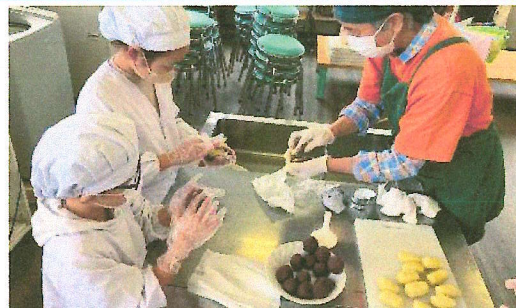
3年生総合学習「御正忌団子づくり」で、作り方を学ぶ子どもたちの様子