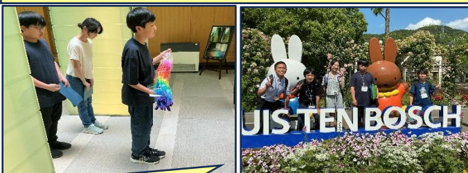
【5月24日(日)～25日(月)：修学旅行】 町内の3小学校連合で長崎方面に行ってきました。平和学習での語り部さんのお言葉「平和とはなんでもない、当たり前の平凡な日々の連続」、この言葉がとても心に響きました。また、語り部さんから「講話を聴くまなざしがいい」とほめていただきました。