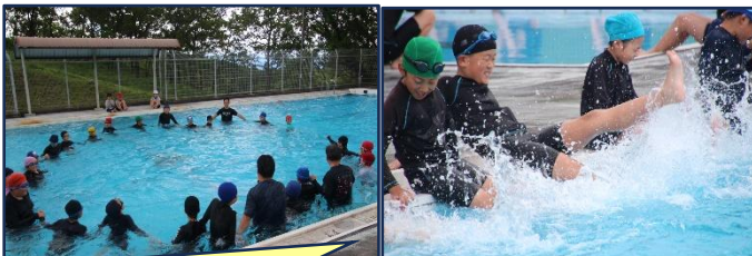
【5月22日(金)：プール開き】 気温25℃、水温23℃の中、県内の小学校でおそらく一番早く行いました。報道6社、町ケーブルテレビから取材があり、この時期の実施は毎年恒例となっています☆