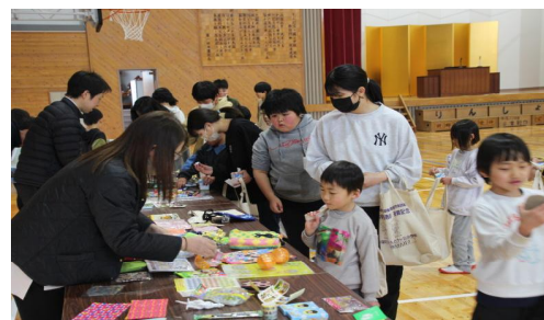
行列ができた第1回りんペイマート