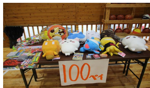
第1回りんペイマートの商品の一部

子供が喜びそうなものであれば何でもかまいません。小物、アクセサリ、おもちゃ、カード、お菓子、クレーンゲームでゲットしたもの、などなどです。