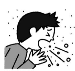
チリやホコリが アレルギーの原因に