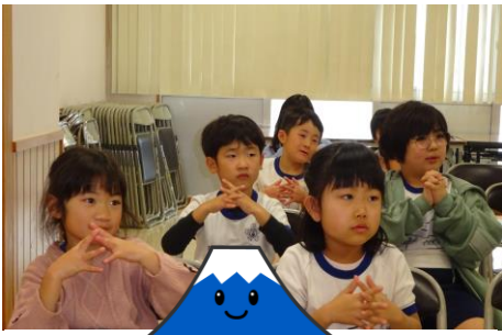
♪あの三角のお山の上で♪ (指と指の間を洗っている所)

3学期が始まってから1~2週目に、各クラス毎に身体測定と病気予防についての保健教育を実施しました。身体測定では、測定カードを持ち帰らせていますので確認をお願いします。