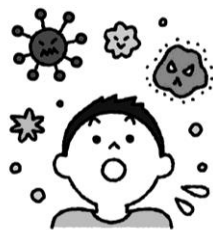
ウイルスに 感染しやすくなる