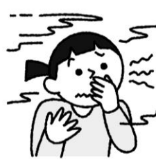
空気が汚れ、 嫌な臭いがする