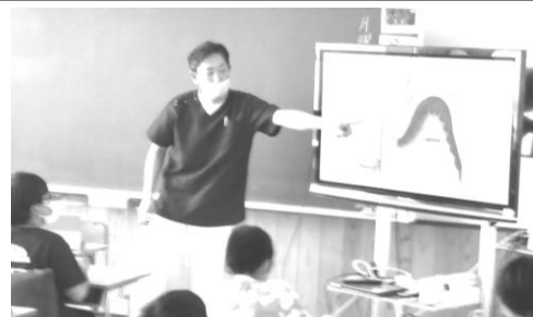
歯と口の健康講話の様子