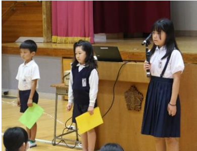
「読む」→「語る・伝える」へ

17日(木)から後期が始まりました。始業式では、1・3・5年の代表児童が頑張りたいことを発表してくれました。相手に「語る・伝える」意識をもち、聞き手の目を見ながら、原稿なしで発表しました。