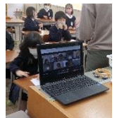
リモート参加と教室の2年生