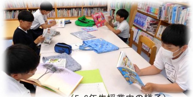
(5・6年生授業中の様子)