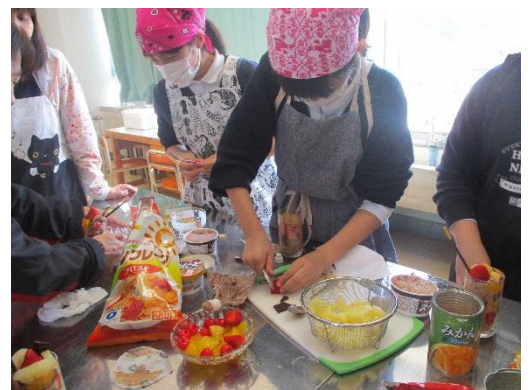
カルチャークラブ

今年度は、「スポーツ・アウトドア」「カルチャー」「カードゲーム」の3つのクラブ活動でした。3年生は、どれを選びますか？次年度のクラブは、まだ決定していませんが、今年度を引き継ぐものが多いと予想されます。