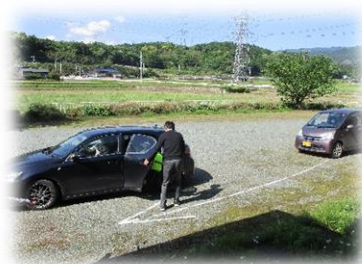
迅速に引き渡し“完了”