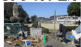
大変お世話になります

これまでの花壇は15cm程の浅いもので花も直ぐに枯れていました。今回は、30cm以上の深さになるようです。正門の桜と綺麗な花の共演で、きっと式等に花を添えてくれる筈です！