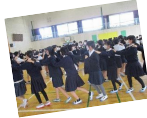
みんなで貨物列車