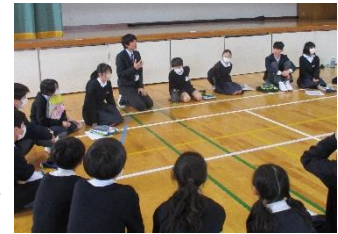
6年生の頃の先生の話