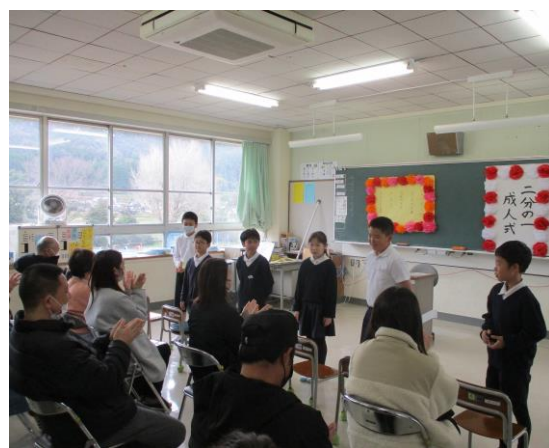
「保護者の皆さん、ありがとうございました」

その後、PTA 総会や学級懇談会を実施しましたが、ともに保護者の皆様のご協力で無事 終えることができました。たいへんありがとうございました。