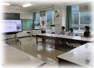
吉田委員長のご挨拶