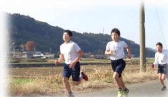
力強い走りの高学年生