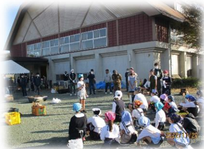
開会（進行は子どもたち）

学校では、今後もコロナ禍の状況を見ながら、できるだけ学校を開放していきたいと考えています。今後ご協力のほど、よろしくお願いします。