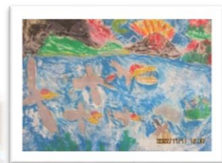
内村さん作「海の恐竜たち」