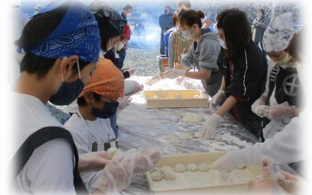
餅を丸め！あん餅も作成