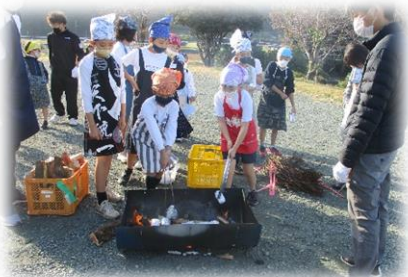
慎重に芋を入れて焼き芋