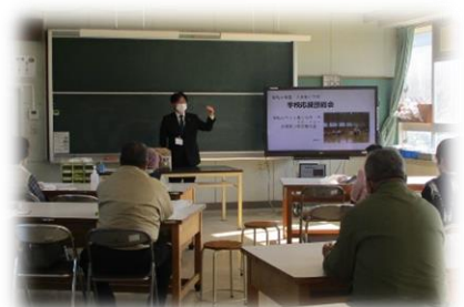
学校応援団の方への説明