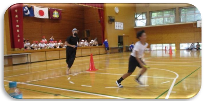
6年生親子競技（リレー）