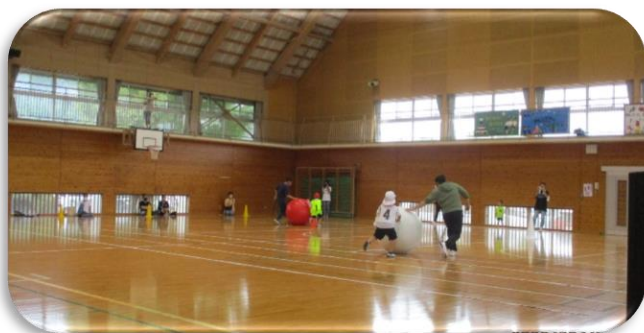
1年生親子競技（大玉転がし）