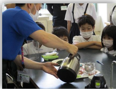
お茶の入れ方講座 (5/24)