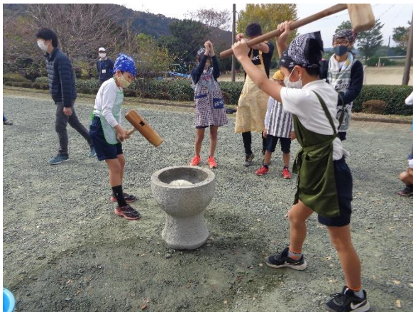
11月21日 親子ふれあいフェスタ

11月に開催した親子ふれあいフェスタでは、子どもたちは縦割り班で活動し、炊き出し、餅つき、餅丸めをそれぞれ体験し、できた餅と焼き芋をそれぞれの班でおいしくいただきました。