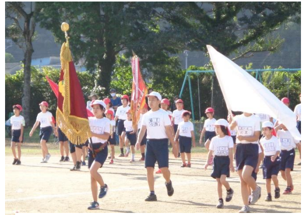
10月2日 秋季大運動会

新型コロナウイルスの感染拡大が続く中ではありましたが、今年度は、休校することもなく、開催できた行事も多くあり、コロナ対応で制限された中であっても充実した教育活動が終えられることに感謝申し上げます。