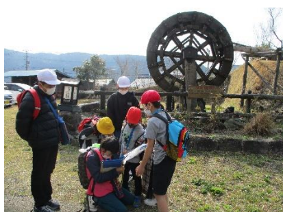
瀬田人の会直売所前の水車

6年生も、このすばらしい地域のことを胸に刻み、中学校へ進学することでしょう。1年生から5年生も6年生とのかけがえのない思い出をつくることができました。