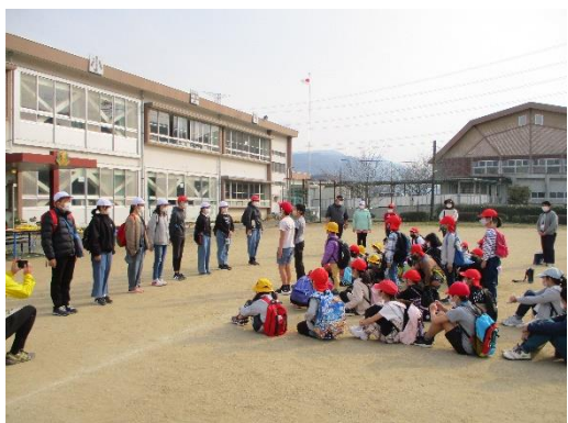
6年生へお礼のことば

3月11日(金)に、送別遠足を行いました。今回は、大津東小学校区のウォークラリー。瀬田地区と大林地区、外牧地区の3つを回るコースで行いました。郷土の自然や歴史について学ぶこと、体力向上、縦割り班で親睦を深めることを目的に、6年生との思い出作りを行いました。瀬田地区では、瀬田人の会直売所の水車や瀬川製茶さんのお茶、大林地区では、宝満神社にまつられている神様、地蔵橋の地蔵、外牧地区では、外牧神社にあるおがたまの木、外牧観音堂のことなど、実際に歩いて立ち寄り、ク