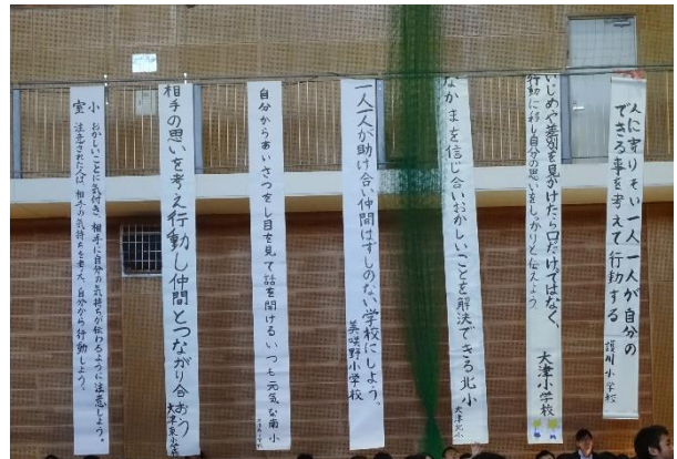
町内の各学校からのスローガンも掲示されました。

昨日の全校集会では、参加した本校の子どもたちの中から5・6年生のそれぞれに、町児童生徒集会で感じたことや学んだことを発表してもらいました。県人権子ども集会や町児童生徒集会を通して子どもたちが学んでくれたことを、11月のニコニコ集会（校内人権集会）の取組にしっかりつなげていきたいと思えます。