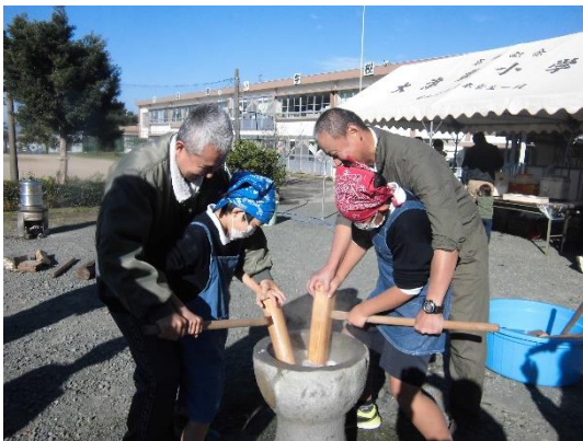
昨年のふれあいフェスタでのもちつきの様子

昨日、収穫したもち米で、つくたてのおいしいお餅も、たくさん用意できると思います。多数のご来校をお待ちしています。