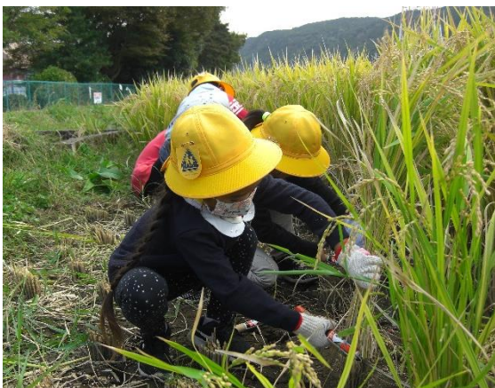
1年生も一生懸命に稲刈りをがんばってくれました。

実りの秋を感じる爽やかな秋晴れに恵まれ、昨日の2・3校時に、全校児童による農業体験学習（稲刈り）を行うことができました。