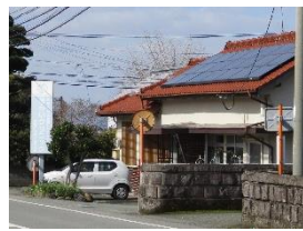
② あらいクリニック