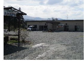
⑧ 介護福祉村おおばやし