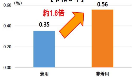
ヘルメット着用状況別の致死率比較【令和3年】