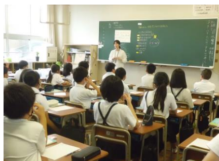
5年生の授業。真剣な語り合いでした。

互いを知ること。正しく知ること。思いを受け止め合 うこと。そして、だれもが幸せに生きていくために、差 別を見抜き、許さない「なかま」になること。人権月間 だけでなく、毎日毎日積み重ねていきます。