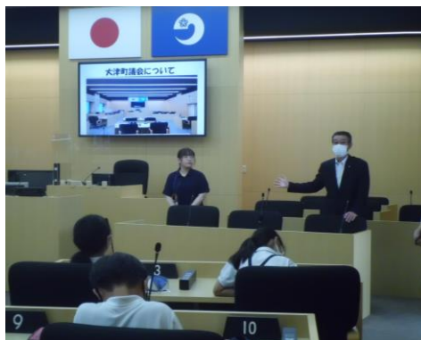
議会の仕組みをお話していただきました

新庁舎になってから、議場に小学生が入るのは初 めてとのこと。貴重な経験をさせていただくことが できました。