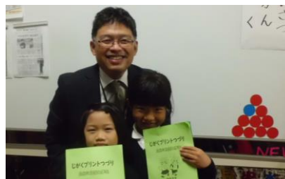
1年生の「自学」第一号 (令和4年10月25日撮影)

後期に入り、全ての学年で「自学」の取組が行われています。2年生以上はノートが1冊終わる毎に、校長室に報告に来てくれます。1年生は、指定された学習シートが10枚を超えると「1冊」として、校長室へ。今週その第1号が届きました。今週から通信右上の数には、1年生の数も含まれます。高学年の児童は、自分の得意なこと、苦手なことを踏まえ、取り組む内容を自分で決めるようアドバイスを送っているところです。