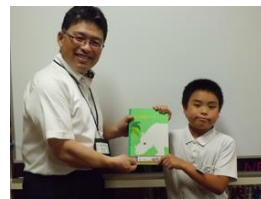
本年度自学ノート第1号 (5月13日 撮影)

運動会まであと一週間あまりとなりました。本日時点での天気予報では、当日は曇りとのこと（ウェザーニュースの情報）です。快晴とまでいなくても、なんとか運動会が実施できることを切に願うところです。感染症の状況も心配ですが、引き続きご家族みんなで「うがい」や「手洗い」、規則正しい生活による体力の維持などの予防に努めていただくようご協力をお願いします。