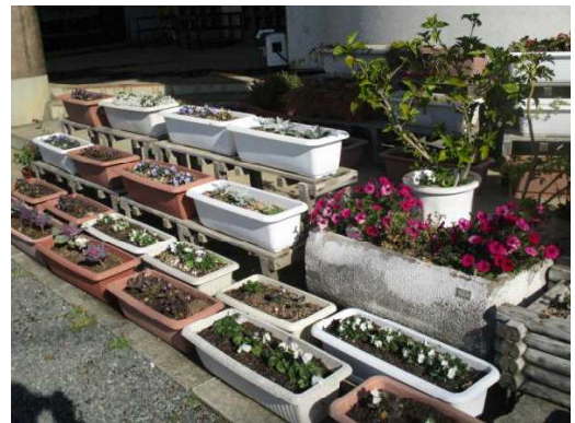
(昇降口のプランター)