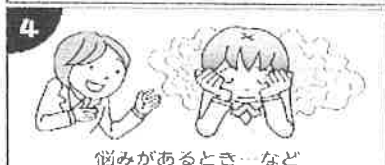
休みがあるとき…など