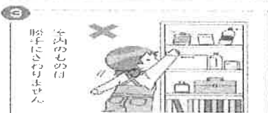
自分のもの 勝手にさわりません