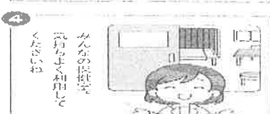
みんなの保健室 元々よく利用して ください