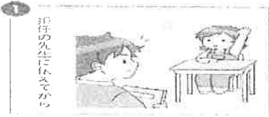
担任の先生に伝えてから