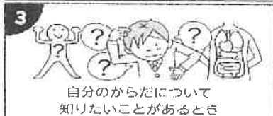
自分のからだについて 知りたいことがあるとき