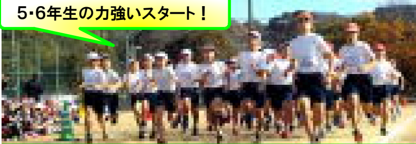
5・6年生の力強いスタート！